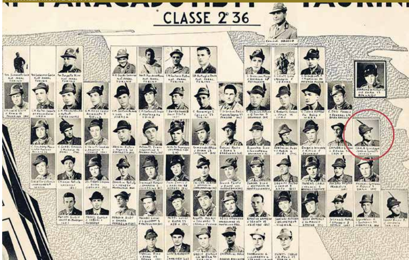
Plotone paracadutisti alla caserma Monte Grappa a Torino, nel 1958 (ultimo lancio il 27 febbraio 1959, sul monte Saccarello). Contattare Eldio Ginevro al nr. 338/6042744.