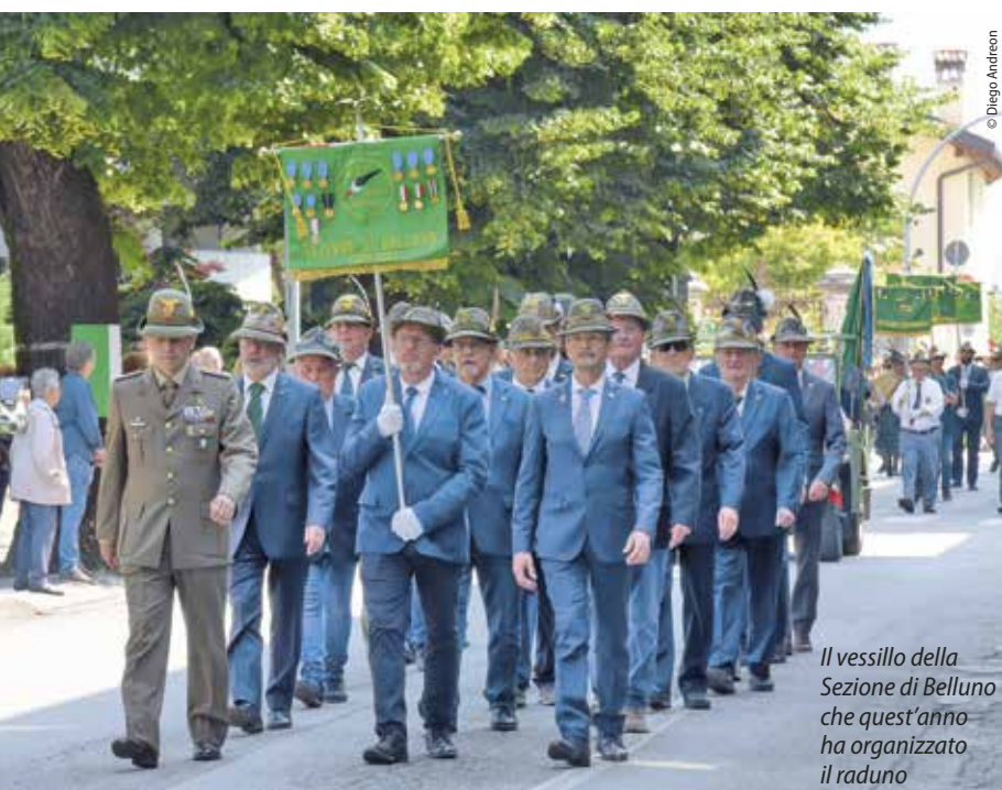
Il vessillo della Sezione di Belluno che quest'anno ha organizzato il raduno