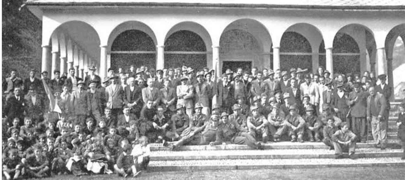
Il raduno delle penne nere carniche al tempio ossario di Timau nel 1946

La Sezione Carnica è presente anche nel campo della cultura. È infatti promotrice di pubblicazioni e della fondazione del museo storico la Zona Carnia durante la Grande Guerra, che conserva numerosi documenti e reperti storici. L'attività della Sezione guarda al futuro con entusiasmo con l'organizzazione sul suo territorio dei Campi scuola, esperienza formativa ma soprattutto gratificante per i giovani partecipanti e per gli organizzatori.