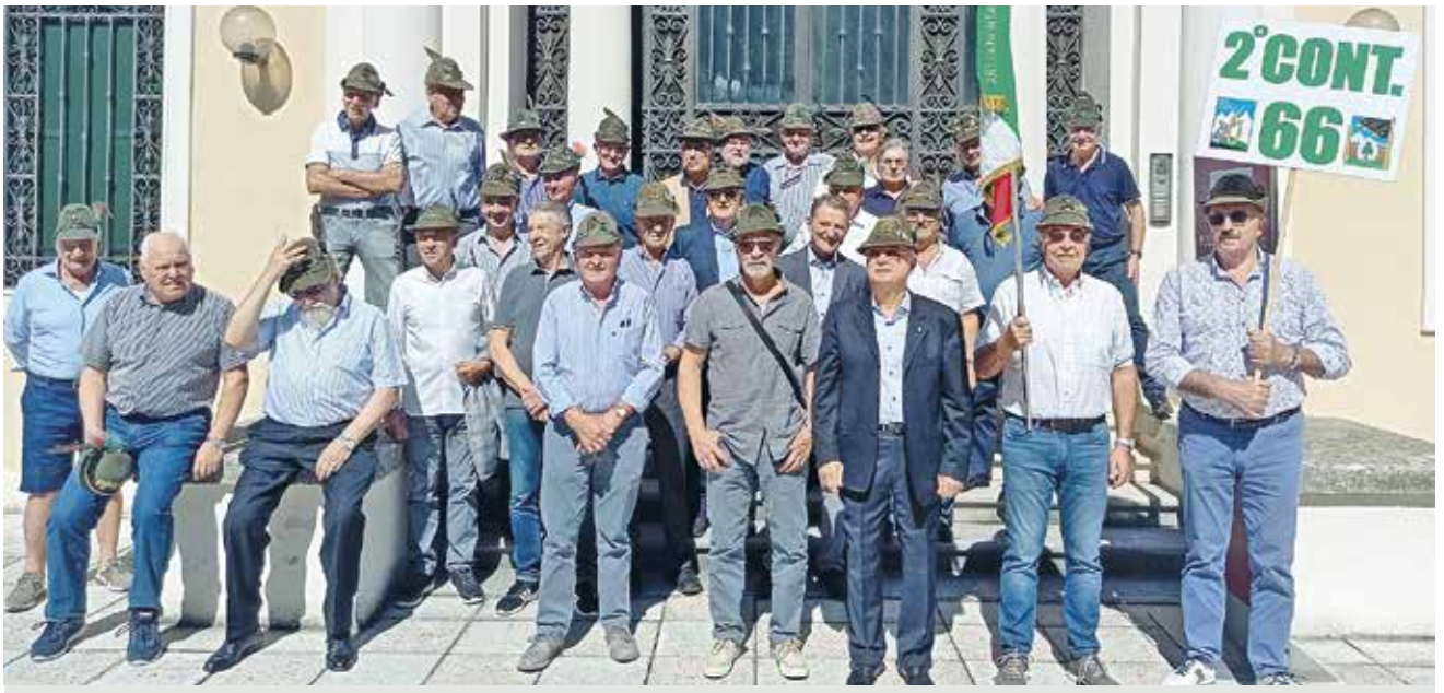
Incontro a 55 anni dal congedo degli artiglieri del gruppo da montagna Pieve di Cadore, 2°/66.