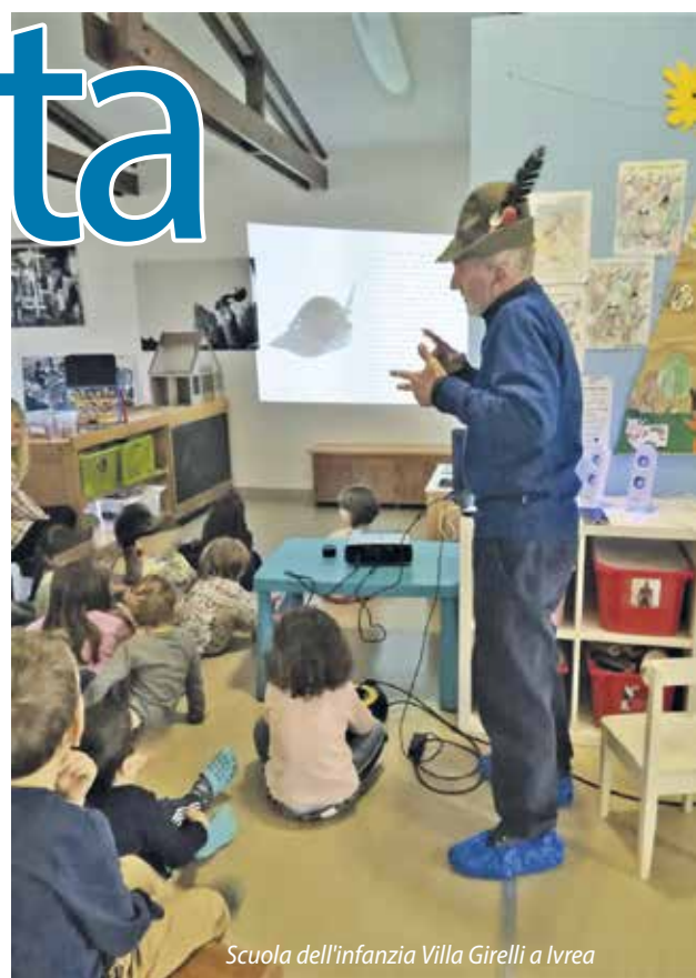
Scuola dell'infanzia Villa Girelli a Ivrea

nostre strutture. La Sezione di Vercelli, per esempio, ha coinvolto gli studenti del locale liceo scientifico nella realizzazione del libro fotografico del ten. Barelli, reduce di Grecia e Albania. Quella di Biella ormai da qualche anno ospita gli studenti del liceo classico per la cura della propria biblioteca e del proprio archivio. I risultati fin qui espressi sono frutto di un impegno appassionato e non senza sacrifici personali, ma volontari, che ha dato vita nei Raggruppamenti, prima nel 1° poi nel 3°, di "coordinamenti" dei Centri studi sezionali: per fare rete delle conoscenze ed esperienze e, insieme, migliorarsi e crescere; il nostro motto è "condivisione" per raggiungere lo scopo comune che ci è stato dato dai nostri padri fondatori quando scrissero l'art. 2 del nostro Statuto. Concludiamo dicendo che il supporto dei coordinamenti si è esteso anche ad altre Sezioni come Francia, Salò e Sardegna alle quali è stato fornito materiale didattico. Inoltre gli stessi coordinamenti sono già al lavoro per preparare i progetti da presentare alle scuole nel prossimo anno scolastico, questo infatti sarà l'argomento principale delle riunioni previste prima della pausa estiva.