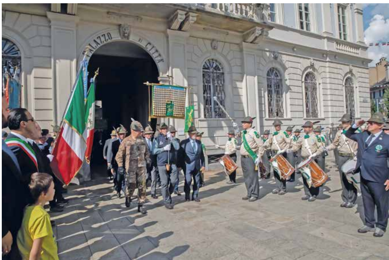
Il Labaro esce dal municipio di Domodossola al suono della fanfara alpina Ossolana

al Labaro e al vessillo domese e la cena sociale.