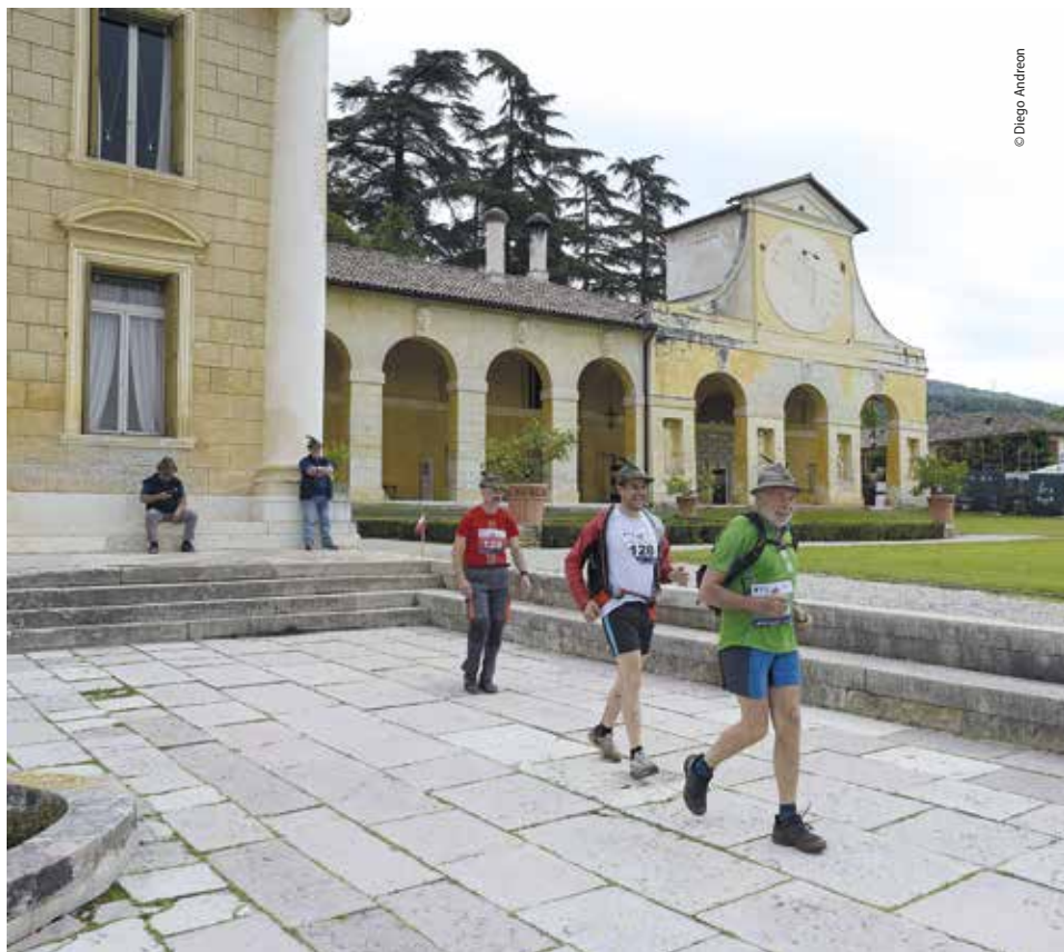
La partenza della gara nella splendida cornice di Villa di Maser