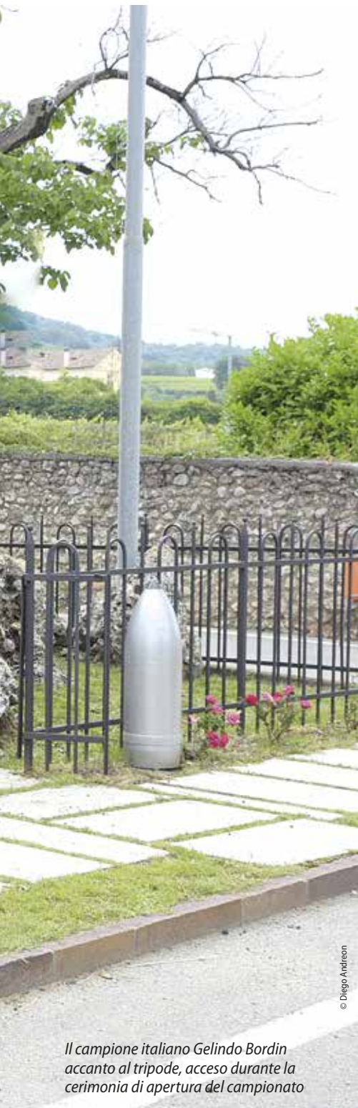
Il campione italiano Gelindo Bordin accanto al tripode, acceso durante la cerimonia di apertura del campionato