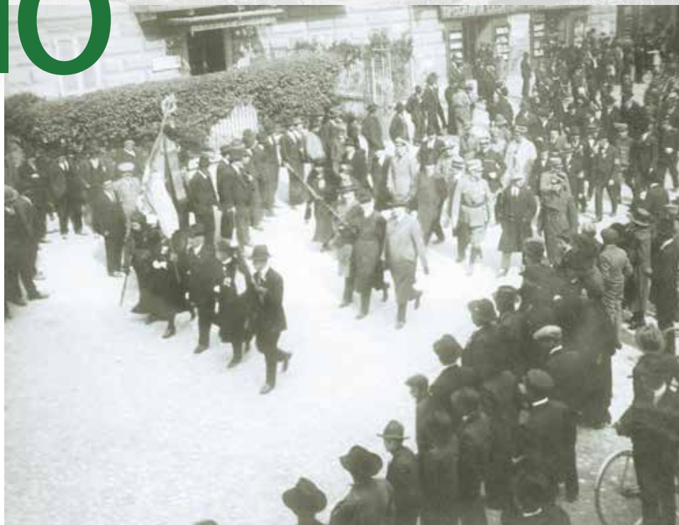
L'inaugurazione del primo gagliardetto della Sezione di Domodossola l'8 aprile 1923

Il centenario si è aperto il 2 giugno nel centro storico con la mostra di tre giorni, "100 oggetti per 100 anni" con cui la commissione cultura sezionale ha raccontato, attraverso cento cimeli, questo secolo di vita partito il 26 gennaio 1923.