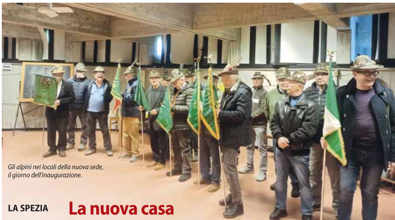
Gli alpini nei locali della nuova sede, il giorno dell'inaugurazione.