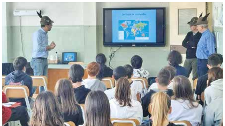
Scuola media San Salvatore

prima linea" con temi inerenti non solo la vita dei soldati al fronte ma anche la guerra vissuta dai civili e le conseguenti trasformazioni sociali come il ruolo delle donne e l'emancipazione. Ha dimostrato quanto sia d'interesse portare conoscenze di aspetti spesso poco considerati dai testi scolastici, parlando non solo di battaglie ma anche di sacrifici e coraggio. Utile spunto di lavoro, per la Sezione di Verona, è stato il progetto della Regio-