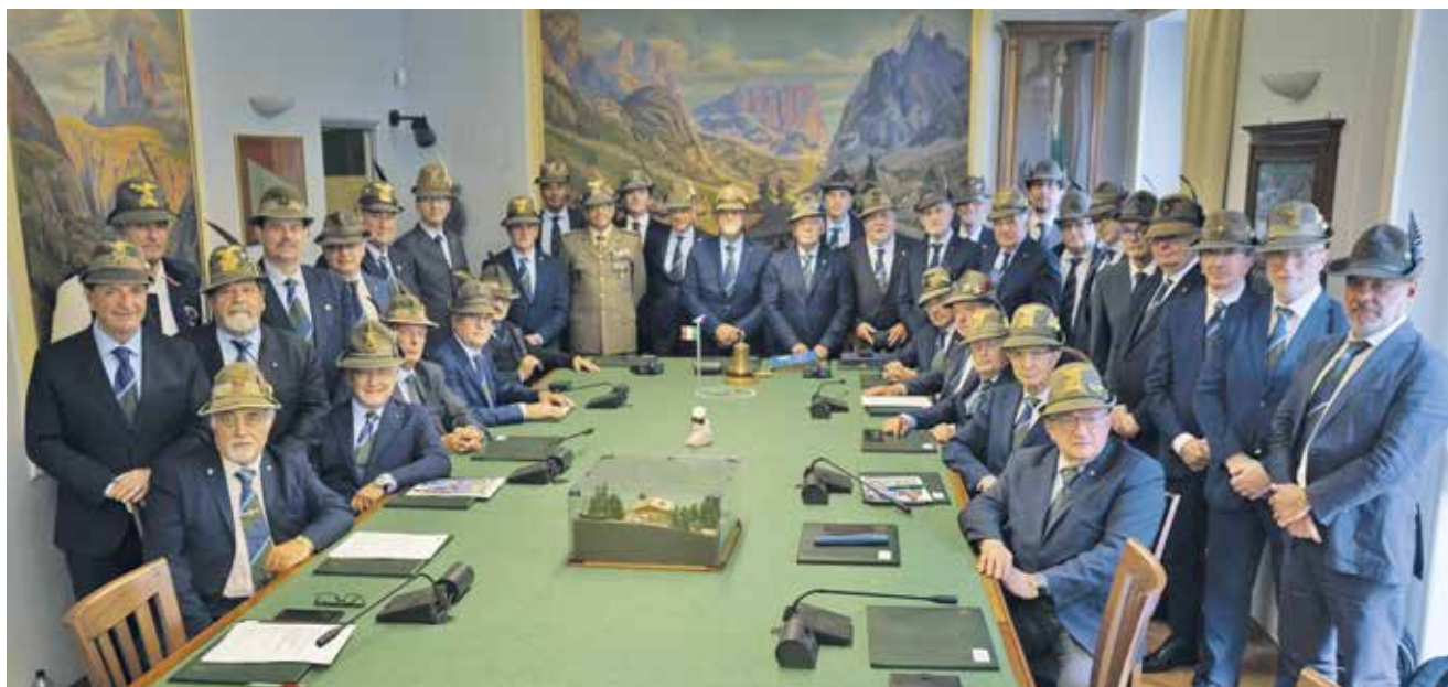
Il Consiglio direttivo nazionale durante la seduta del 10 giugno scorso

È iscritto al gruppo alpini Piani di Bolzano, partecipa attivamente alla vita associativa portando il proprio contributo e la propria esperienza maturata anche in altri ambiti associativi e di volontariato.