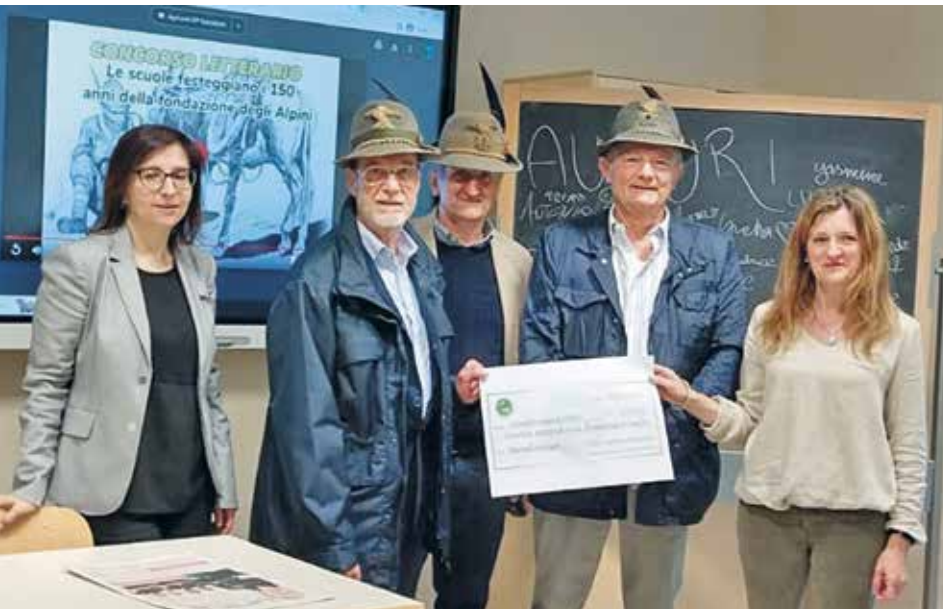
Scuola media di Mondovì

ne Veneto "Storia e cultura del Veneto 2022/23" che invita ad approfondire storie venete di emancipazione e resilienza, racconti di donne e bambini in fuga dal Veneto dopo Caporetto, e proporle alle scuole. Il "Giro delle lapidi" della Sezione di Vicenza "Monte Pasubio", che ha reso possibile agli studenti di conoscere personaggi, come imprenditori e artisti, che hanno lasciato tracce importanti nella vita cittadina. Tutte le Sezioni del Triveneto in particolare, data la vicinanza con i luoghi che sono stati teatro della Grande Guerra, vi accompagnano le scolaresche unendo la didattica della storia sul campo alla conoscenza della montagna e la sua frequentazione in sicurezza (possibili rischi, attenzioni da prestare, abbigliamento da indossare). Difficile indicare numeri precisi, ma sono sicuramente decine le visite organizzate dalle varie Sezioni dal Grappa al Carso finché a Caporetto, o dal Cadore all'Altipiano di Asiago e al Montello fino al Piave, dopo centinaia di incontri svolti in aula incontrando migliaia di alunni e studenti, e interessando decine di relazioni con insegnanti; aspetto importante questo per facilitare l'attenzione anche di altri colleghi alle nostre proposte di collaborazione didattica educativa. Un grazie va