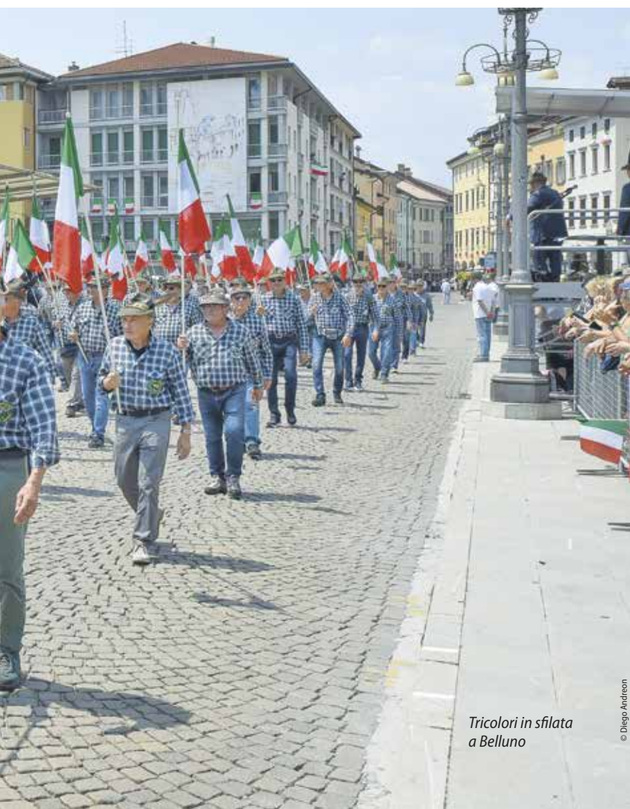
Tricolori in sfilata a Belluno