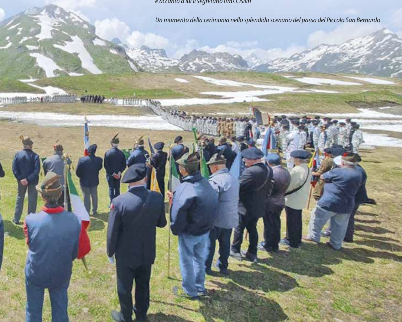
Un momento della cerimonia nello splendido scenario del passo del Piccolo San Bernardo