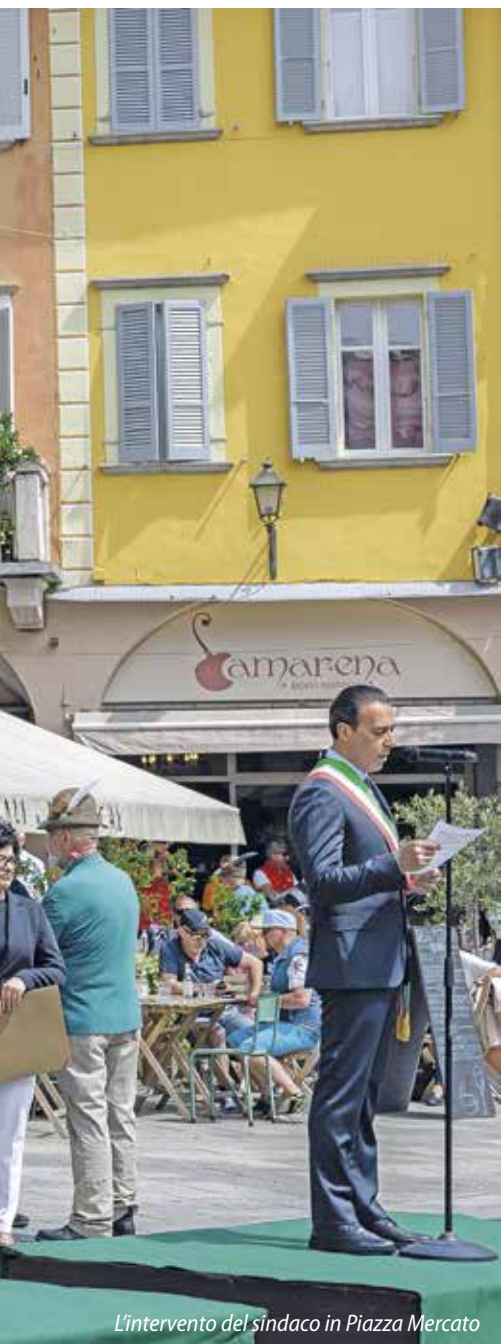
L'intervento del sindaco in Piazza Mercato