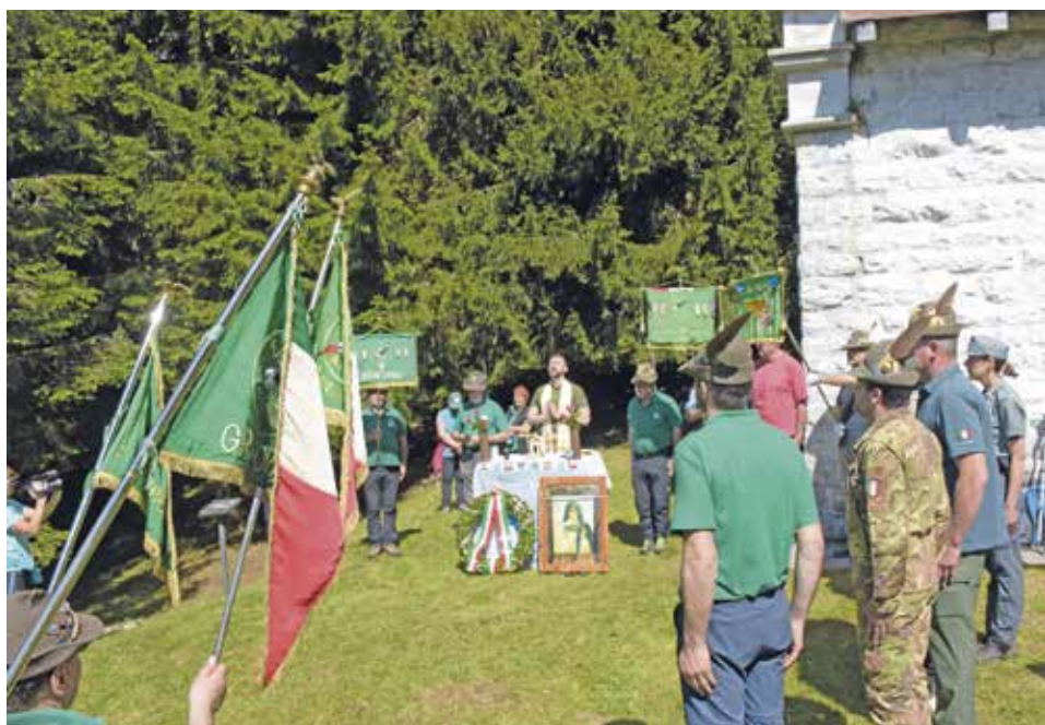
La Messa alla cappella del Pal Piccolo

L'anno successivo vede la luce il notiziario Carnia Alpina che è ancora oggi un importante mezzo di informazione per i vari Gruppi locali e non solo.