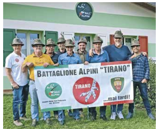
Ritrovo degli alpini del btg. Tirano, cp. Ccs, 8°/88.