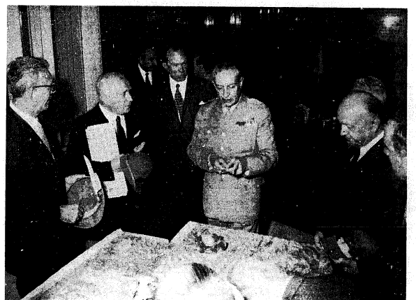
L'incontro cordiale col Generale San Giorgio

li perché da Cuneo a Udine, da Torino a Tolmezzo, da Aosta a Bolzano, dovunque vi è una caserma alpina si materializza il miracolo di veder riunita la grande famiglia verde. « Famiglia verde » non è un termine recente o inventato da noi. Lo troviamo spesso e volentieri in passato fin da quando i primi reduci della guerra 1915-1918 si riunirono all'insediata delle Fiamme verdi per dar luogo ad un'unica grande famiglia che doveva accogliere tra le sue braccia non solo gli alpini in congedo, ma anche quelli alle armi. Domenica 14 questa famiglia era tutta idealmente riunita e se al cronista, librato in aria da sogni di fantascienza, fosse stato possibile scrutare dall'alto nelle varie caserme, avrebbe avuto modo di constatare che mai come in quel giorno il termine di famiglia era così appropriato. Infatti la nostra Presidenza Nazionale, gli alpini delle 76 Sezioni situate in territorio nazionale e della Sezione Svizzera si sono recati a rendere omaggio ai giovani alle armi presso tutti i comandi e reparti delle truppe alpine.