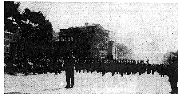
Sfilata a Roma la sezione più numerosa dell'A.N.A.