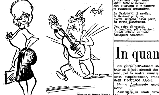
...non ho più l'età...