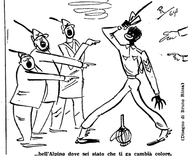
...bell'Alpino dove sei stato che ti ga cambià colore...