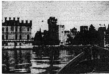
Un suggestivo panorama di Lazise