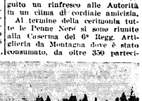
La benedizione del vessillo