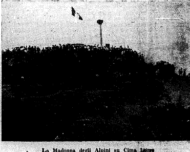
La Madonna degli Alpini su Cima Lozze

«L'11 mattino dopo, 13 luglio, la Valle di Canomonte, che da Asiago, per Gallo porta a Passo Struzzo, era tutta un'immagine di alpini che, con ogni mezzo, salvavano al luogo del convegno.