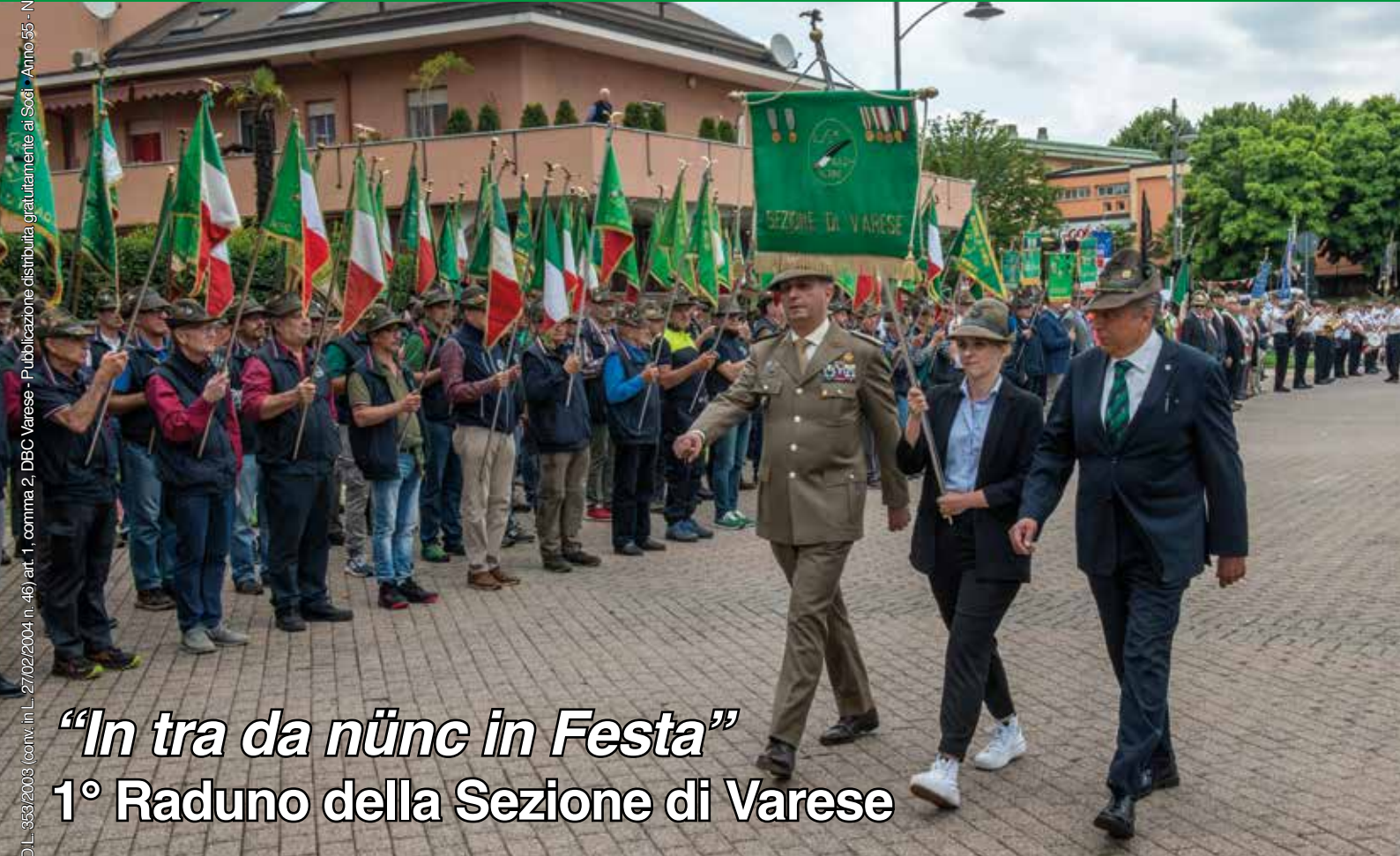
“In tra da nūnc in Festa” 1° Raduno della Sezione di Varese

Periodico della Sez. Alpini di Varese - Direzione via Degli Alpini 1 - Varese - Poste Italiane S.p.A. - S.A.P. - D.L. 353/2003 (conv. in L. 27/02/2004 n. 46) art. 1, comma 2, DBC Varese - Pubblicazione distribuita gratuitamente ai Soci - Anno 55 - N° 2 - LUGLIO 2024