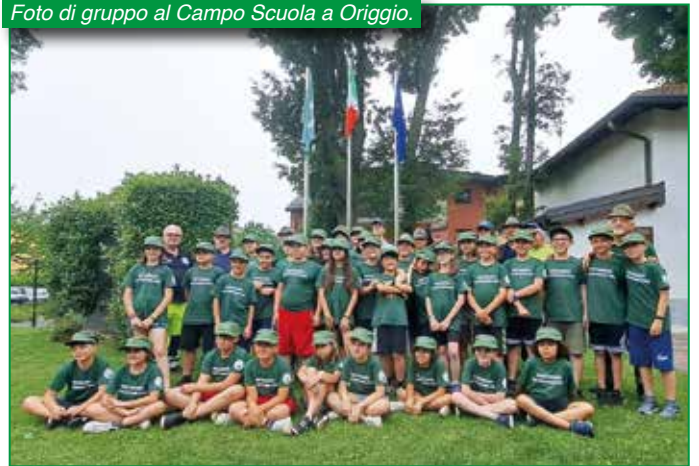
Foto di gruppo al Campo Scuola a Origgio.