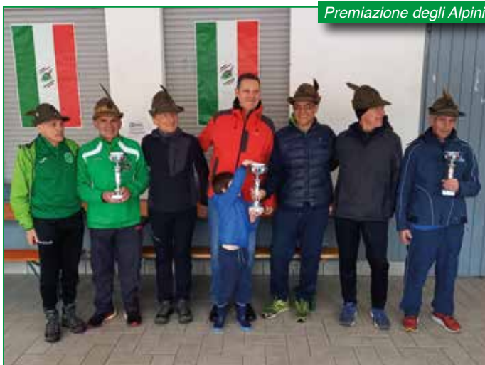
Premiazione degli Alpini.