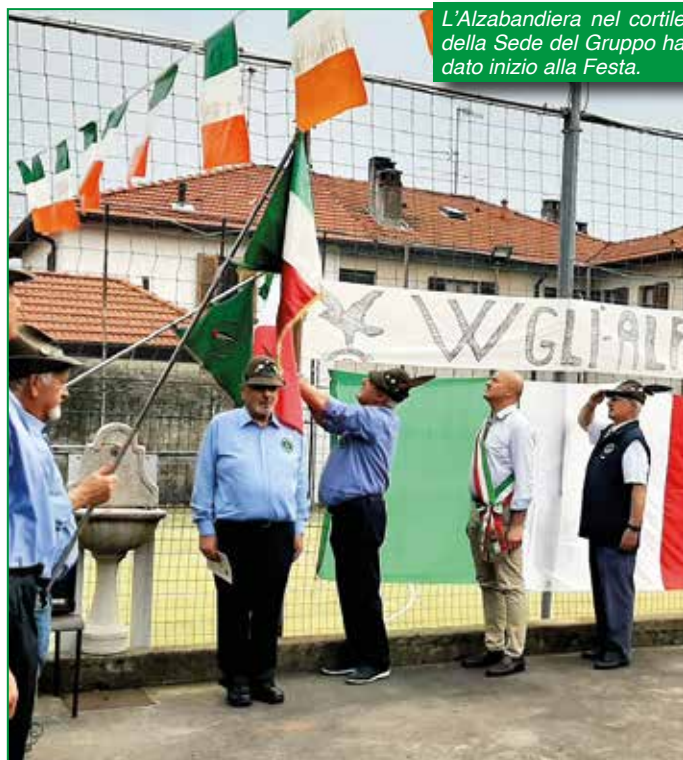
L'Alzabandiera nel cortile della Sede del Gruppo ha dato inizio alla Festa.