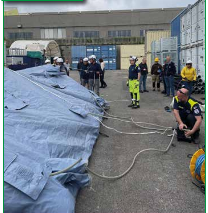
Prova pratica di allestimento tenda gonfiabile a 3 archi.