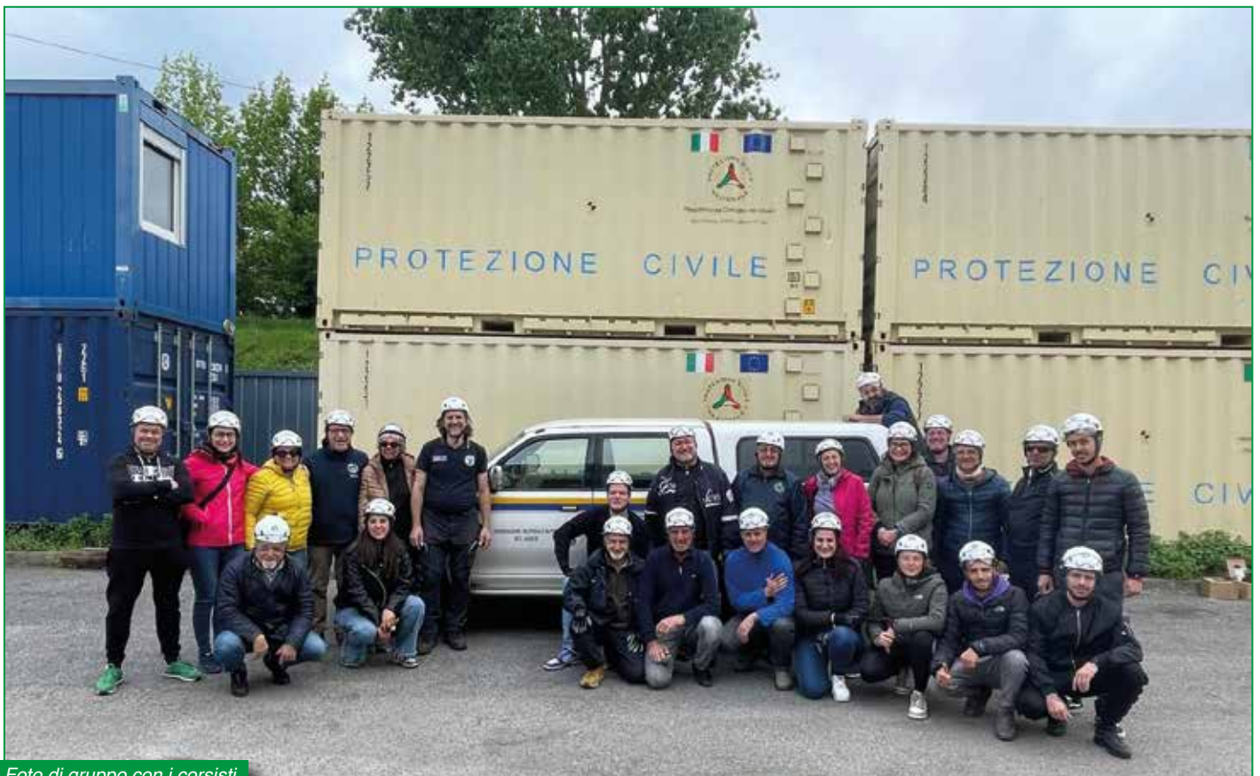
Foto di gruppo con i corsisti.