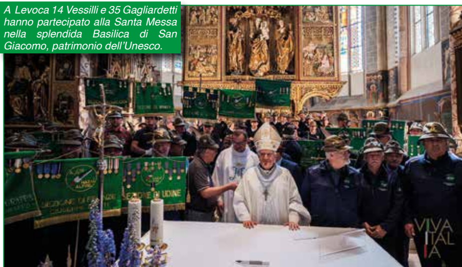
A Levoca 14 Vessilli e 35 Gagliardetti hanno partecipato alla Santa Messa nella splendida Basilica di San Giacomo, patrimonio dell'Unesco.