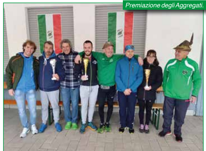
Premiazione degli Aggregati.