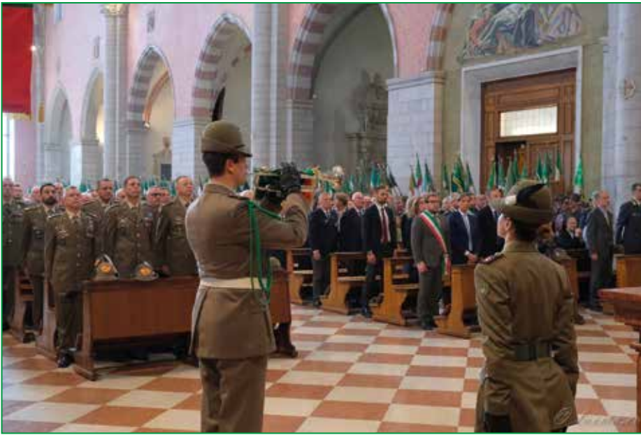
Altro capitolo di ogni Adunata è la sfilata solenne del Labaro Nazionale e del Vessillo della Sezione ospitante, nella fattispecie quello di Vicenza Monte

Pasubio, un percorso breve, ma molto affollato e molto applaudito: le oltre duecento Medaglie d'Oro del Labaro Nazionale sono la dimostrazione tangibile del valore dimostrato dagli Alpini dalla prima volta che sono stati chiamati a combattere o a prestare aiuto a chi ne ha bisogno a oggi.