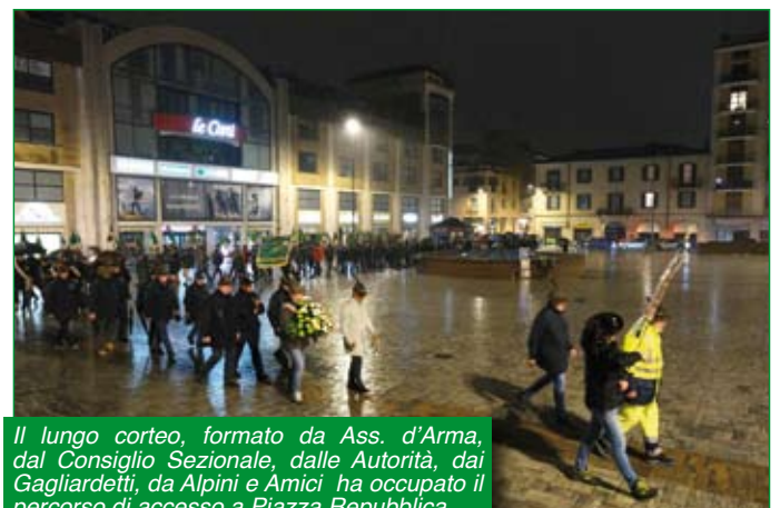
Il lungo corteo, formato da Ass. d'Arma, dal Consiglio Sezionale, dalle Autorità, dai Gagliardetti, da Alpini e Amici ha occupato il percorso di accesso a Piazza Repubblica.