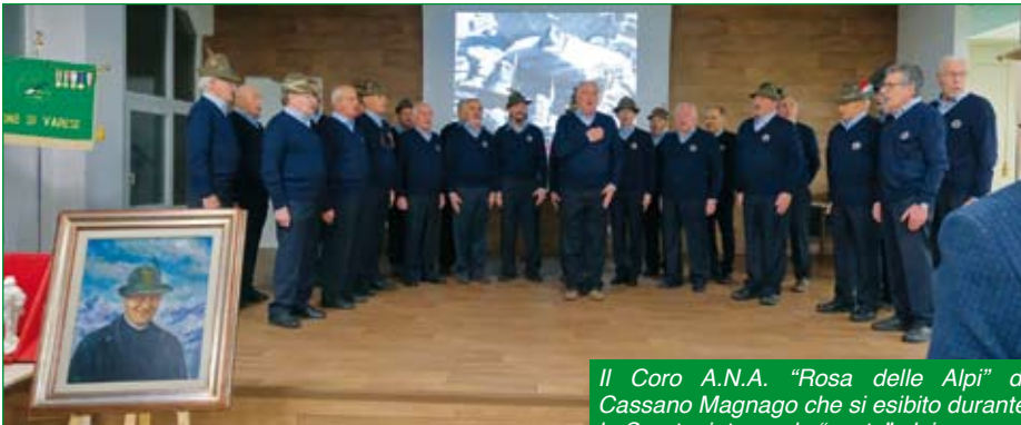
Il Coro A.N.A. "Rosa delle Alpi" di Cassano Magnago che si esibito durante la Serata, intonando "canta" alpine.