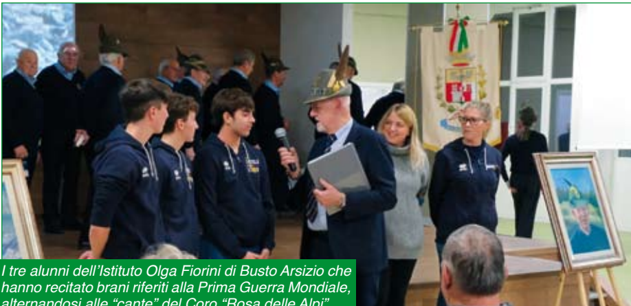
I tre alunni dell'Istituto Olga Fiorini di Busto Arsizio che hanno recitato brani riferiti alla Prima Guerra Mondiale, alternandosi alle "canta" del Coro "Rosa delle Alpi".

Alcune cante del Coro hanno poi concluso la bella Serata.