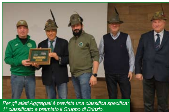
Per gli atleti Aggregati è prevista una classifica specifica: 1° classificato e premiato il Gruppo di Brinzio.