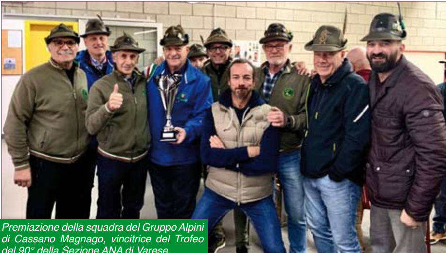
Premiazione della squadra del Gruppo Alpini di Cassano Magnago, vincitrice del Trofeo del 90° della Sezione ANA di Varese.

Purtroppo la pandemia non ci ha permesso di organizzare gare sportive sia nel 2020 che nel 2021.