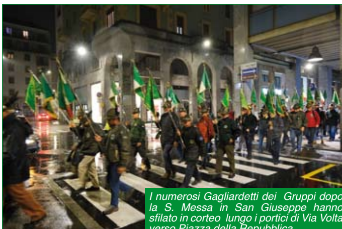
I numerosi Gagliardetti dei Gruppi dopo la S. Messa in San Giuseppe hanno sfilato in corteo lungo i portici di Via Volta verso Piazza della Repubblica.