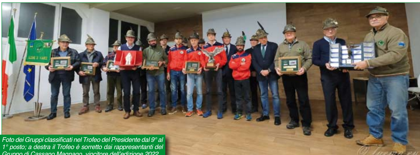
Foto dei Gruppi classificati nel Trofeo del Presidente dal 9° al 1° posto; a destra il Trofeo è sorretto dai rappresentanti del Gruppo di Cassano Magnago, vincitore dell'edizione 2022.