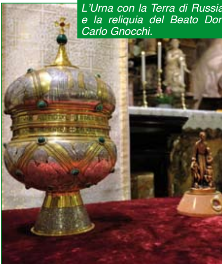
L'Urna con la Terra di Russia e la reliquia del Beato Don Carlo Gnocchi.

Segue da Pag. 3 Al termine una delegazione composta essenzialmente dai consiglieri sezionali presenti, si è recata presso la statua del "MOSE" per deporre un mazzo di fiori su una lapide (molto dimenticata) che ricorda il sacrificio degli Alpini nel corso delle ultime guerre.