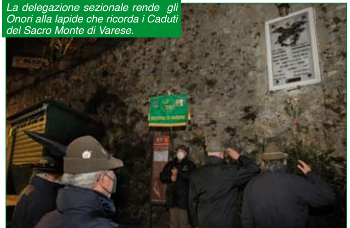
La delegazione sezionale rende gli Onori alla lapide che ricorda i Caduti del Sacro Monte di Varese.