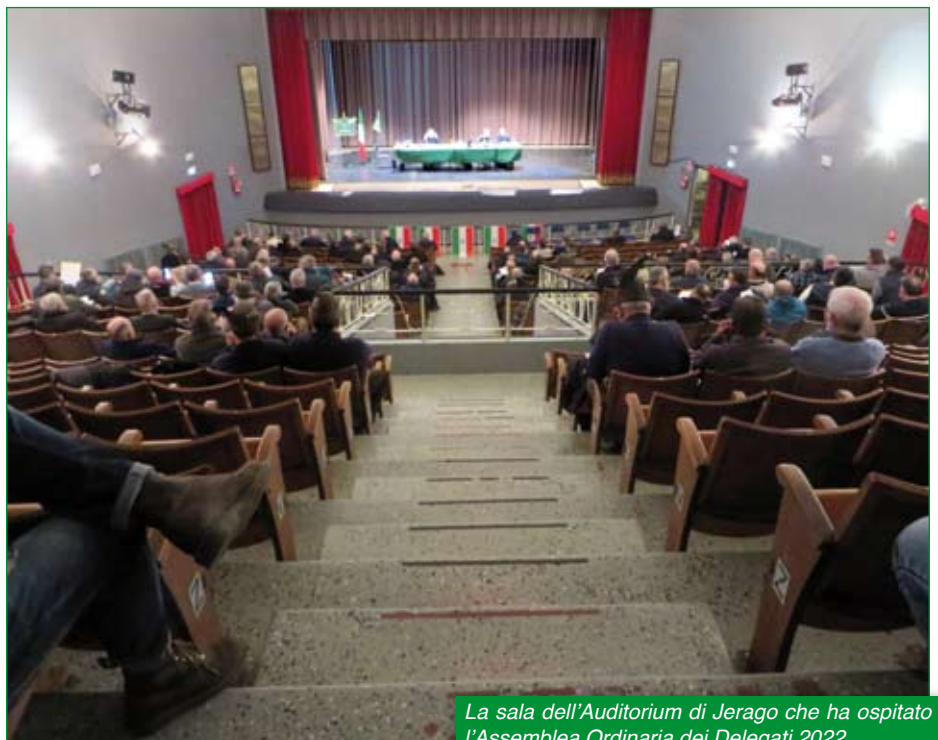
La sala dell'Auditorium di Jerago che ha ospitato l'Assemblea Ordinaria dei Delegati 2022.