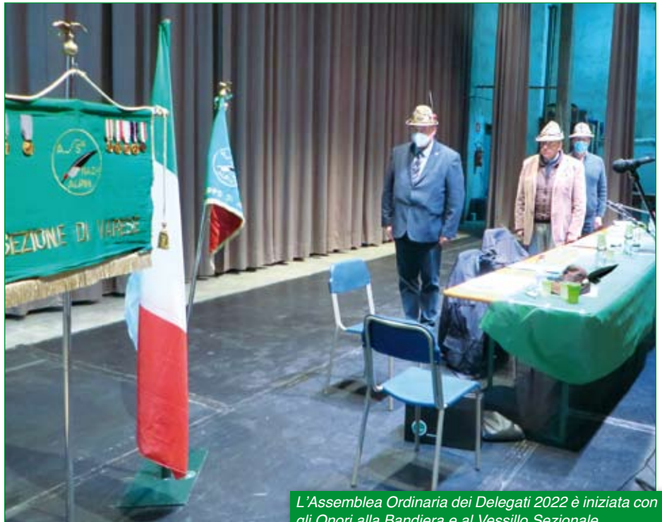
L'Assemblea Ordinaria dei Delegati 2022 è iniziata con gli Onori alla Bandiera e al Vessillo Sezionale.