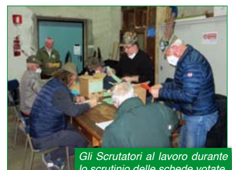
Gli Scrutatori al lavoro durante lo scrutinio delle schede votate.