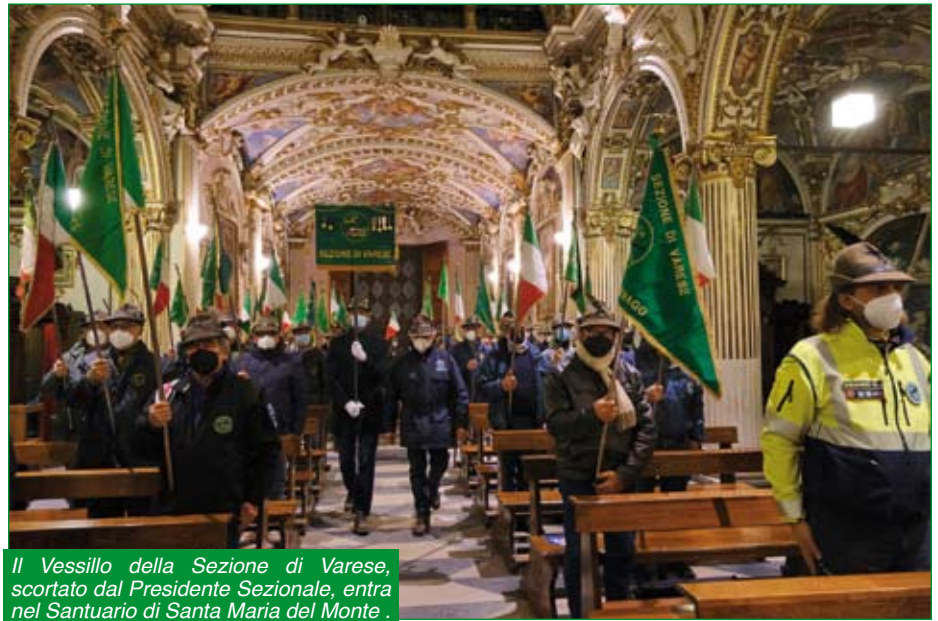
Il Vessillo della Sezione di Varese, scortato dal Presidente Sezionale, entra nel Santuario di Santa Maria del Monte.

Dopo l'interruzione forzata dell'anno scorso a causa della pandemia, quest'anno la Sezione di Varese ha riproposto per mercoledì 26 gennaio 2022 la tradizionale e sempre partecipata cerimonia in ricordo della battaglia di Nikolajewka.