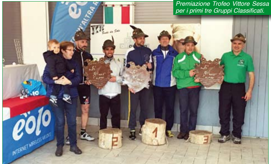
Premiazione Trofeo Vittore Sessa per i primi tre Gruppi Classificati.

Il Trofeo Vittore Sessa è aggiudicato al Gruppo di Capolago e il Trofeo Valerio Piccinelli al migliore atleta classificato