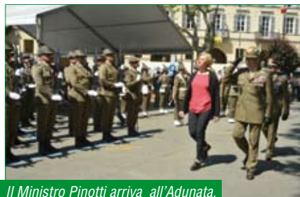
Il Ministro Pinotti arriva all'Adunata.