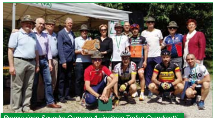
Premiazione Squadra Carnago A vincitrice Trofeo Grandinetti.