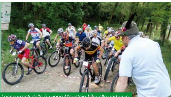
I concorrenti della frazione Mountain-bike alla partenza.