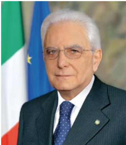
Il Presidente della Repubblica Sergio Mattarella

«Gli Alpini contribuiscono a mantenere sempre viva la memoria dei valori dell'identità della Repubblica»