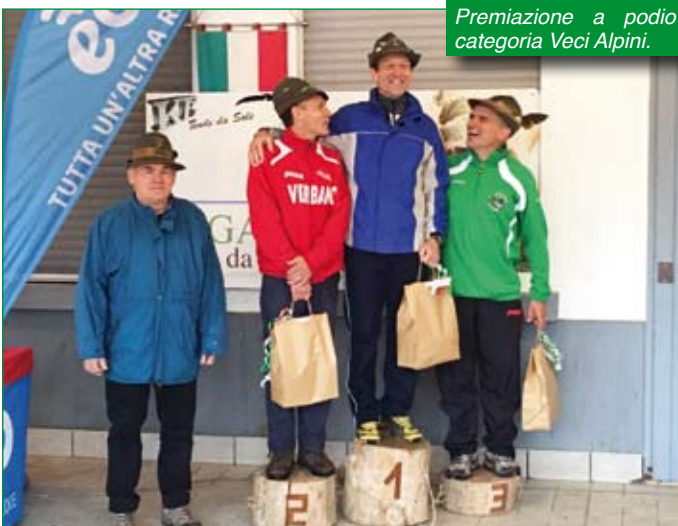
Premiazione a podio categoria Veci Alpini.