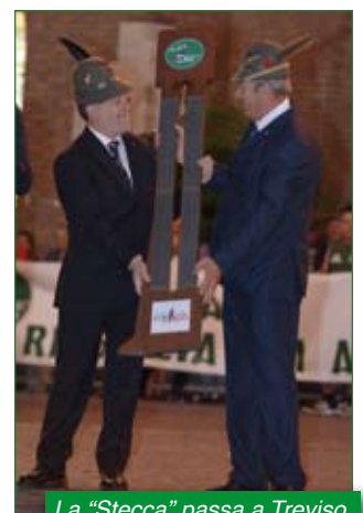
La "Stecca" passa a Treviso.