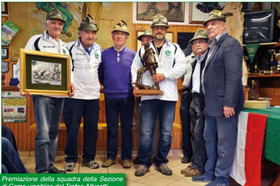
Premiazione della squadra della Sezione di Como vincitrice del Trofeo Albisetti.