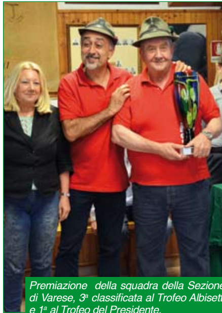
Premiazione della squadra della Sezione di Varese, 3ª classificata al Trofeo Albisetti e 1ª al Trofeo del Presidente.