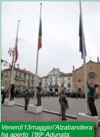
Venerdì 13 maggio l'Alzabandiera ha aperto l'89 a Adunata.