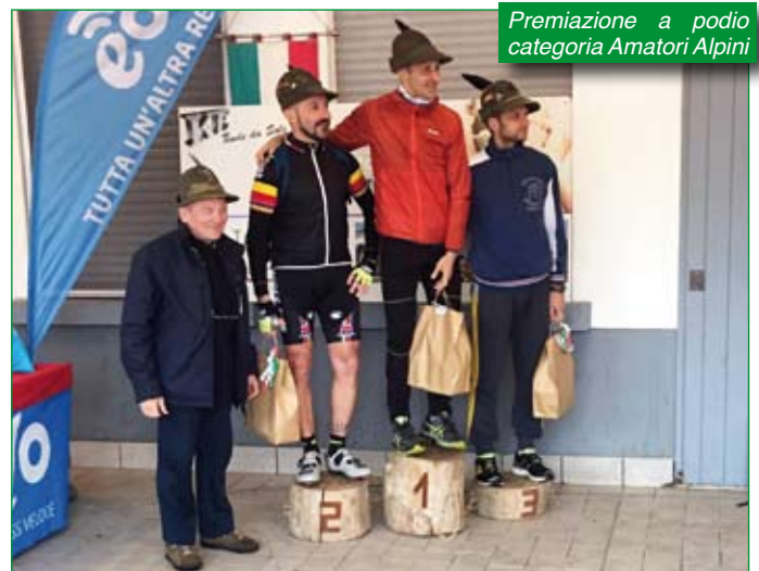
Premiazione a podio categoria Amatori Alpini.