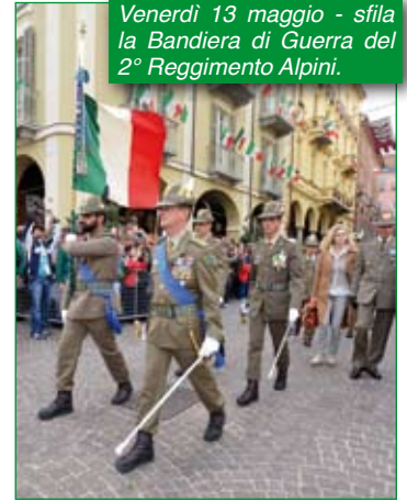
Venerdì 13 maggio - sfilata la Bandiera di Guerra del 2° Reggimento Alpini.

(continua da Pag. 1) meno piccole, altri in macchina, altri in camper, altri vanno negli alberghi, altri ancora arrivano in moto e altri si sistemano in paesi vicini, però tutti lasciano il posto occupato sempre perfettamente pulito e in ordine, non ci sono eccezioni.